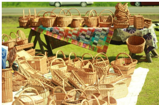
Рис. 1 1