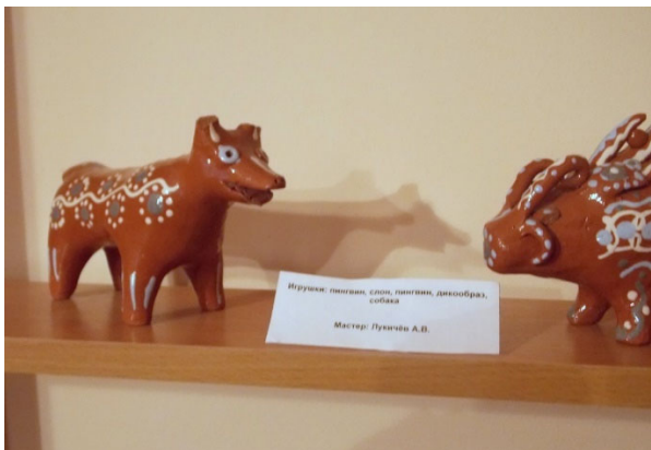
Рис. 1. Оятская игрушка 6