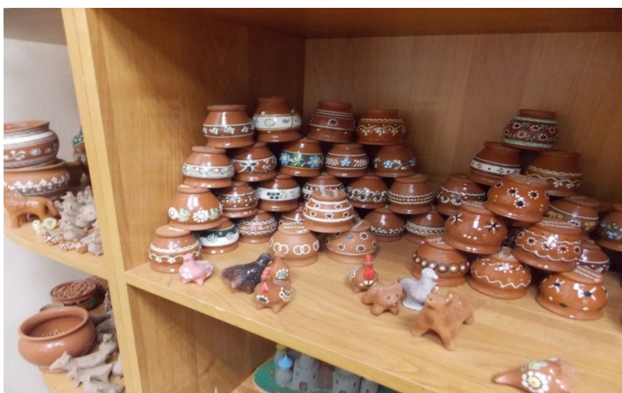
Рис. 5. Керамика 8