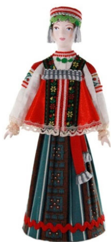
Рис. 5 Кукла коллекционная девушка в традиционном девичьем костюме