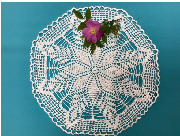
Рис. 2. Ажурная вязка крючком ручной работы