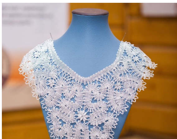
Рис. 3. Колье «Любава» 5