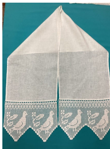
Рис. 6. Полотенце с голубями