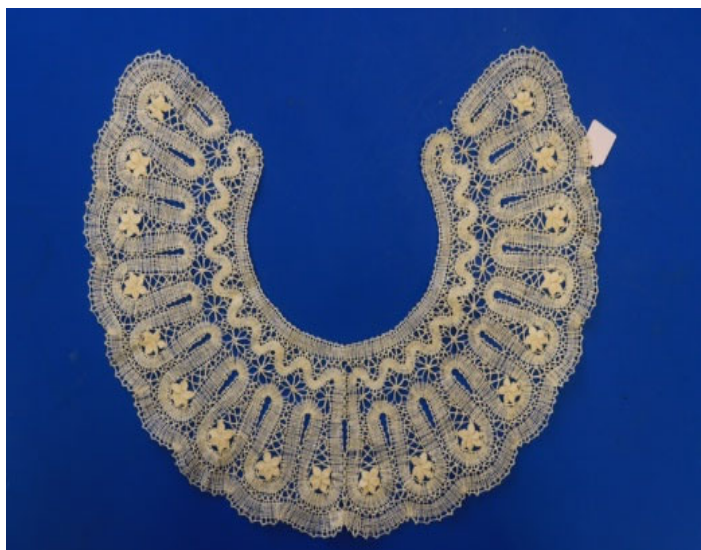
Рис. 1. Воротник «Подсолнух» 4