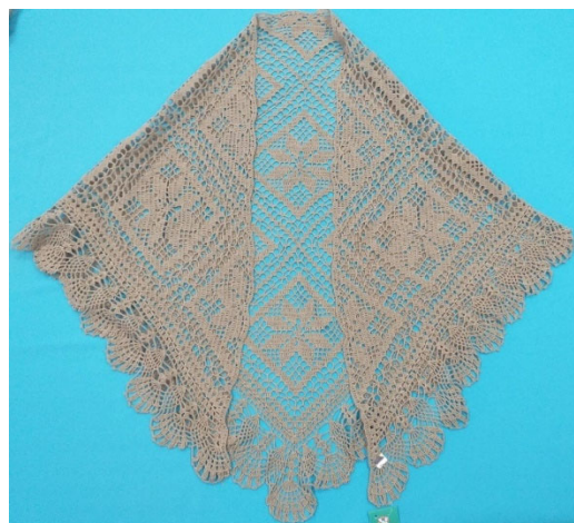
Рис. 4. Шаль из грубого льна