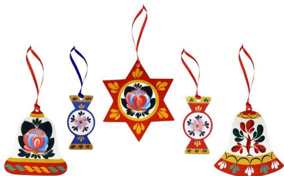
Рис. 3. Набор из 5 новогодних подвесных украшений с композициями Волховской росписи