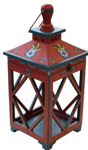
Рис. 2. Фонарь декоративный большой «Яркое цветение» 11