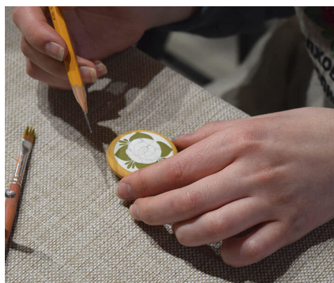
Рис. 5. Мастер-класс по традиционной Волховской росписи