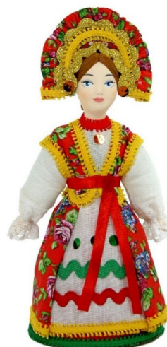
Рис.6. Кукла сувенирная Девушка в русском костюме