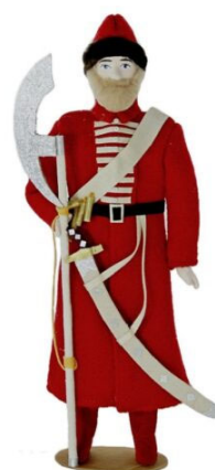
Рис. 4. Кукла коллекционная Стрелец.