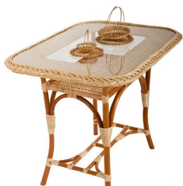
Рис. 3. Стол из ивового прута (лозы) Столешница прямоугольной формы со скругленными углами, отверстием и со стеклом, плетёная полка под столешницей