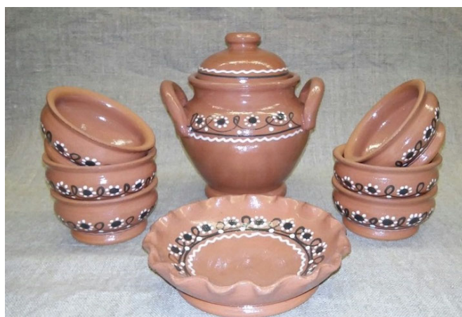
Рис. 4. Посуда