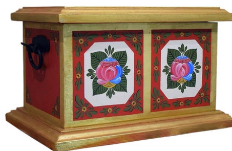
Рис. 4. Деревянный сундук с отдельной крышкой и черными коваными ручками, расписанный композициями традиционной Волховской росписи