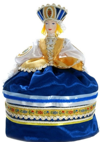
Рис. 1. Кукла на чайник