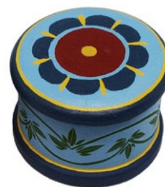
Рис. 4 Миниатюрная шкатулка с элементами Шугозерской росписи