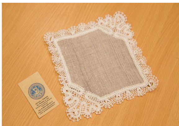
Рис. 5. Салфетка «Павлинка»