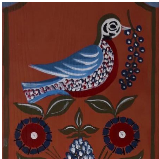
Рис. 1 Панно с традиционной Шугозерской росписью 10