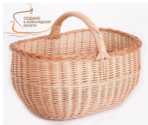
Рис. 6. Корзина