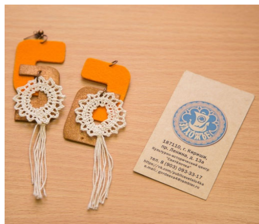
Рис. 4. Серьги «Захожский зубчик»