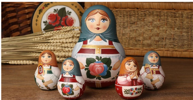
Рис.1 Невалышки 3