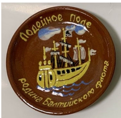
Рис. 3. Сувенирная продукция