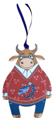
Рис. 5. Новогоднее подвесное украшение «Бычок»