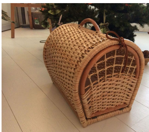
Рис. 5. Переноска для животных