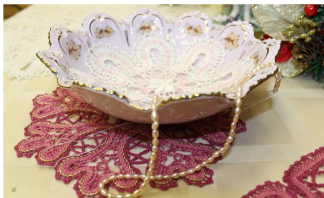
Рис. 6. Праздничная сервировка с кружевом