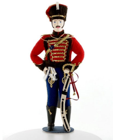
Рис.3. Кукла коллекционная Гусар.