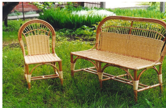
Рис. 2. Диван без подлокотников плетеный из лозы на каркасе из ивовой палки 2