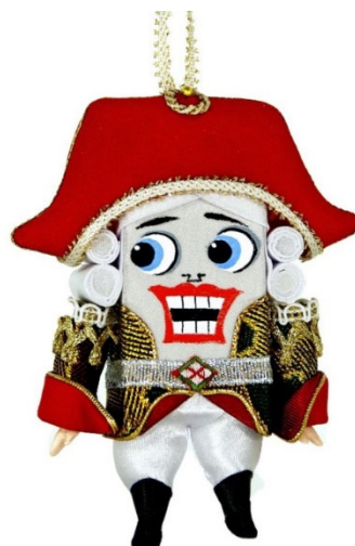
Рис. 2. Подвеска Щелкунчик