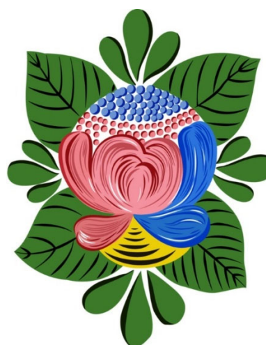
Рис. 6. Волховский розан