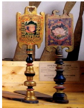
Рис. 2. Прялки