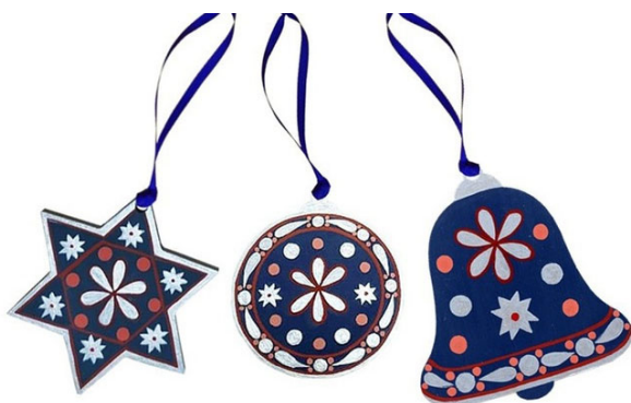
Рис. 3. Набор из 3 новогодних подвесных украшений