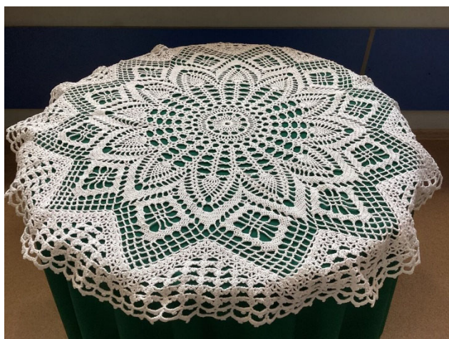
Рис. 5. Скатерть круглая.