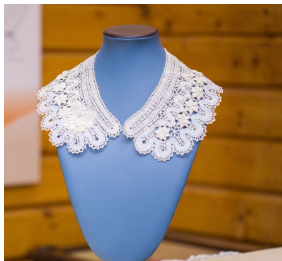
Рис. 2. Воротник «Звездки»