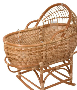
Рис. 4. Плетеная колыбель из ивового прута (лозы)