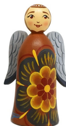
Рис. 6. Фигурка-ангел «Яркое цветение»