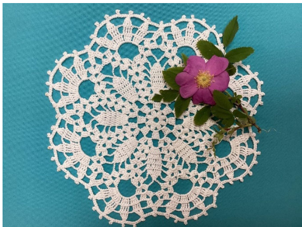
Рис. 1 Ажурная салфетка, связанная вручную крючком из хлопка белого цвета 9