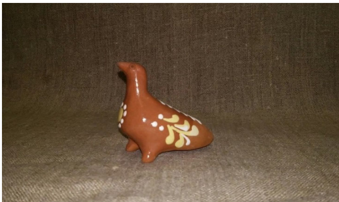
Рис. 2. Свистулька 7